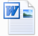
Insurance 101 Final.doc